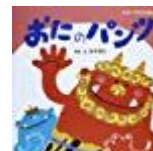
鈴木博子（構成・イラスト） ひさかたチャイルド

おにのぼんつは いいぼんつ つよいぞ つよいぞ とらのけがわで できている つよいぞ つよいぞ ごねん はいても やぶれない つよいぞ つよいぞ じゅうねん はいても やぶれない つよいぞ つよいぞ はこう はこう おにの ぼんつ はこう はこう おにの ぼんつ あなたも あなたも あなたも あなたも～ みんなで はこう おにの ぼんつ